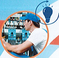
Métiers de l'Électricité