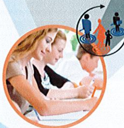
3 e Prépa métiers