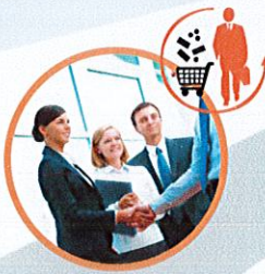
Commerce et Vente