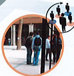
Remédiation et Insertion