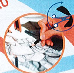
Métiers de la Mode