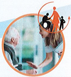
Soins, Services à la Personne, petite enfance